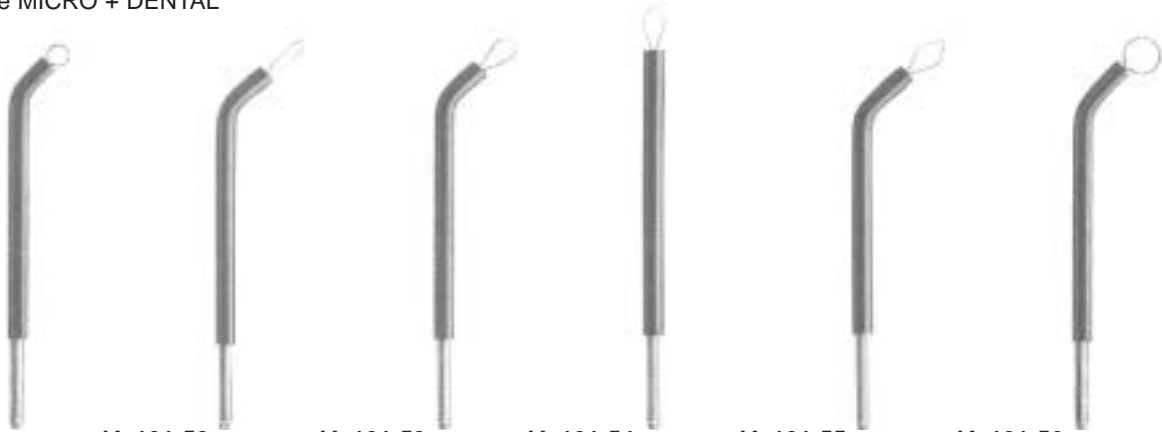
JA-101-51 Fig. 51 Ø 3 mm 45°