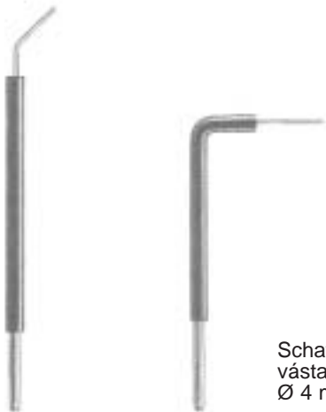
JA-101-61 Fig. 61 45°