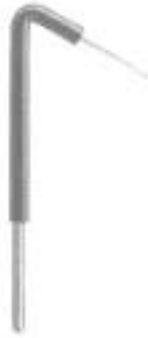
JA-100-03 Fig. 3 120°